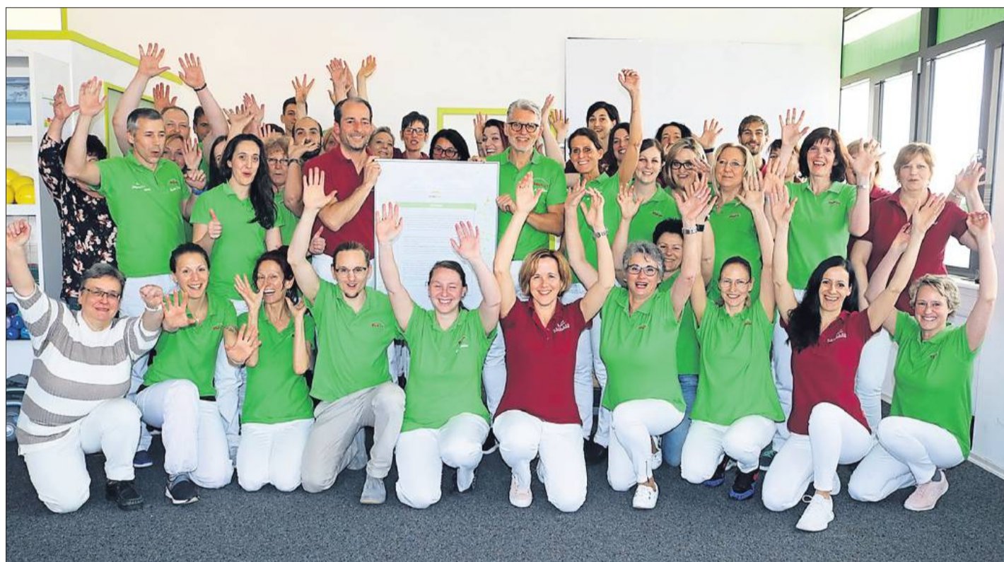
Das Team der Orthopädie, Allgemeinmedizin, Physiotherapie, Ergotherapie und Trainingstherapie

Ergänzt werden diese Leistungsbereiche durch ein therapeutisch orientiertes Fitnessstudio mit Monatsmitgliedschaften zwischen drei und 24 Monaten, der „KORE Academy europe“, deren Fortbildungsangebote der speziellen „KORE“-Therapie sich vor allem an Ärzte und Physiotherapeuten richten, sowie einem vielfältigen Kursprogramm mit dem Schwerpunkt Rehabilitationssport.